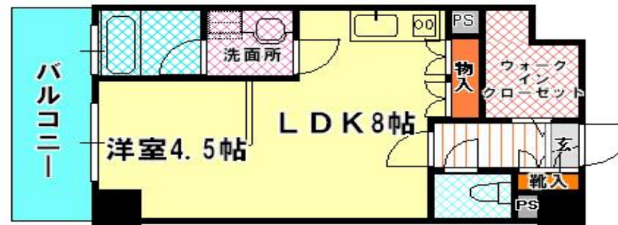
803号室 1LDK 34.29㎡ 賃料：79,000円 2月12日退去予定 503号室 1LDK 34.29㎡ 賃料：77,000円 3月末日退去予定