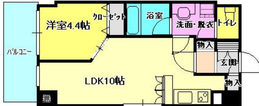
504号室 1LDK 37.31㎡ 賃料：80,000円 3月末日退去予定